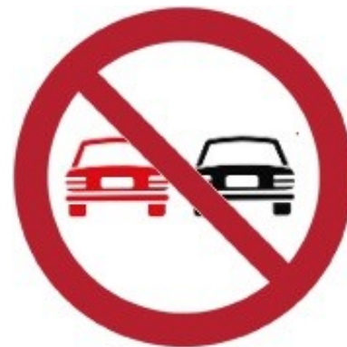
Divieto di sorpasso