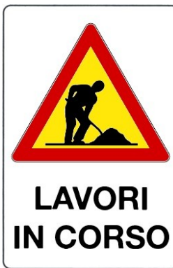
Lavori in corso